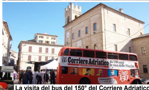
La visita del bus del 150° del Corriere Adriatico