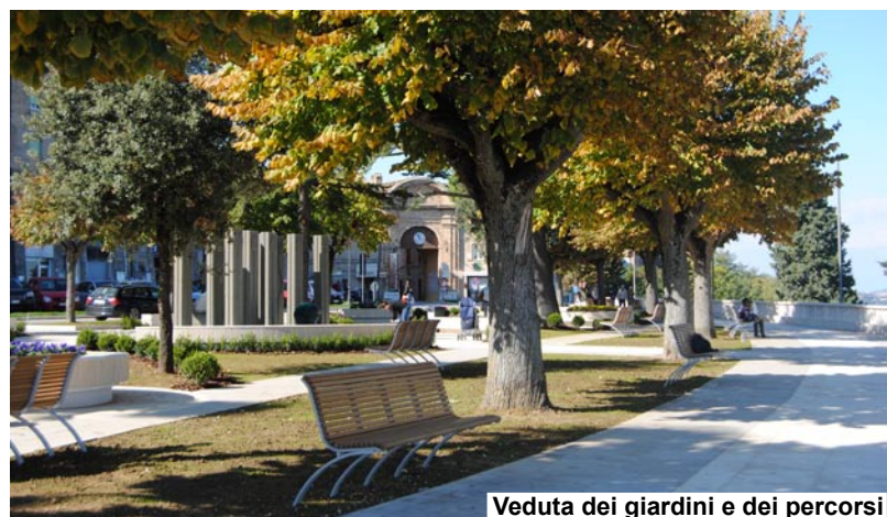
Veduta dei giardini e dei percorsi