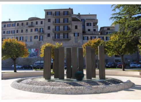
La fontana di Tonino Guerra