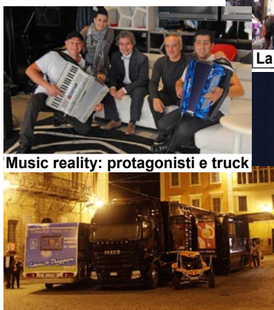
Music reality: protagonisti e truck