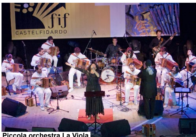
Piccola orchestra La Viola