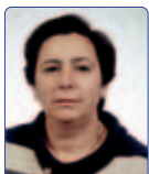
Calimici M. Assunta Solidarietà Popolare