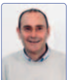
Gambi Osvaldo Solidarietà Popolare