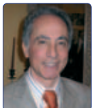
Lorenzetti Valentino Unione