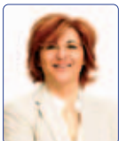
Pompei Marina Unione