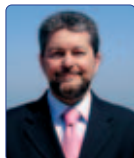
Bompadre Giovanni Solidarietà Popolare