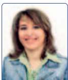
Marini Maila Solidarietà Popolare