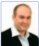
Cingolani Marco Alleanza Nazionale