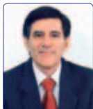
Olmetti Giovanni Solidarietà Popolare