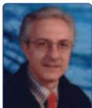
Carini Massimo Unione