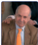
Canali Vincenzo Unione