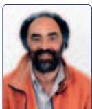
Balestra Marco Solidarietà Popolare