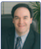
Scatolini Maurizio Forza Italia