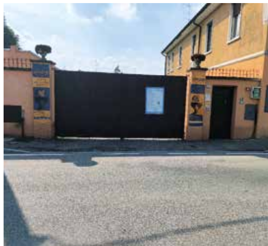
Spazio Ariosto 72