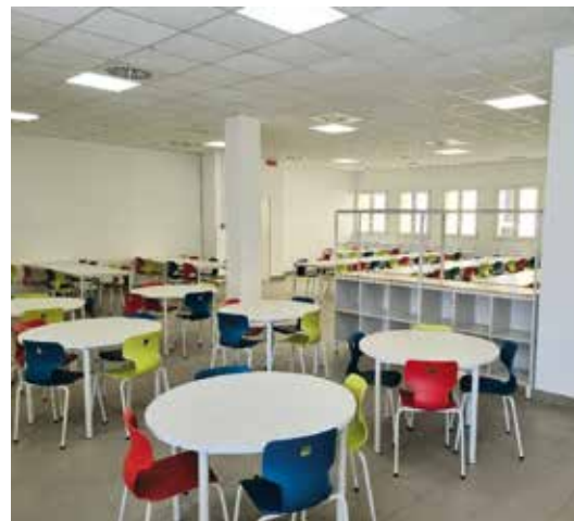
Mensa Ignoto Militi

la mensa Ignoto Militi: uno spazio dedicato ai bambini di Caronno affinché possano passare dei momenti insieme nella pausa pranzo e possano