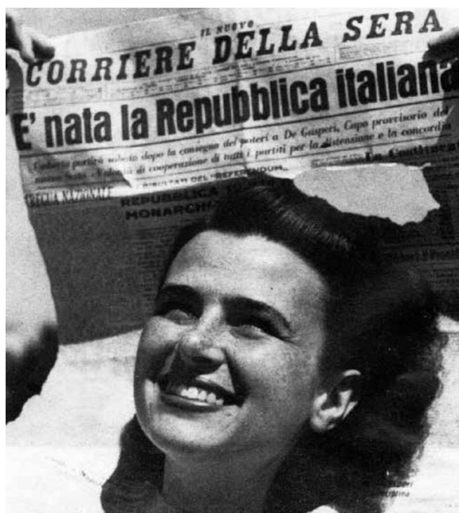
Voto alle donne - 10 marzo 1946