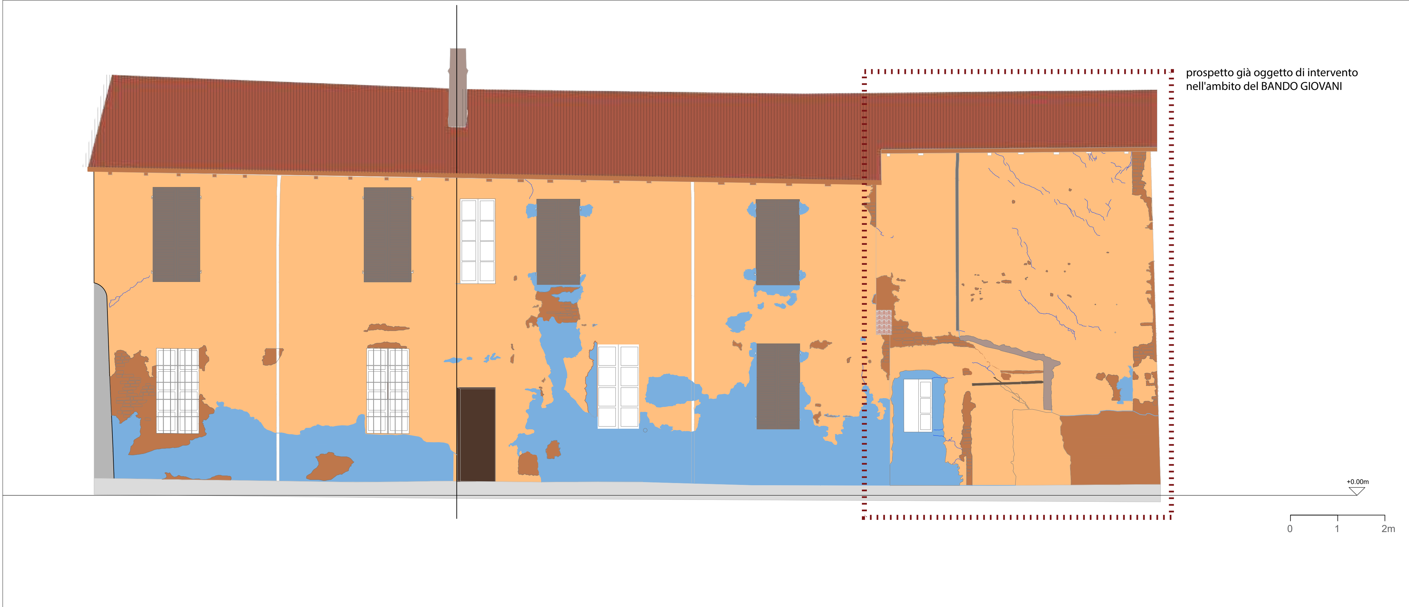
PROSPETTO NORD-OVEST rilevo materico eseguito prima della realizzazione delle opere del BANDO GIOVANI