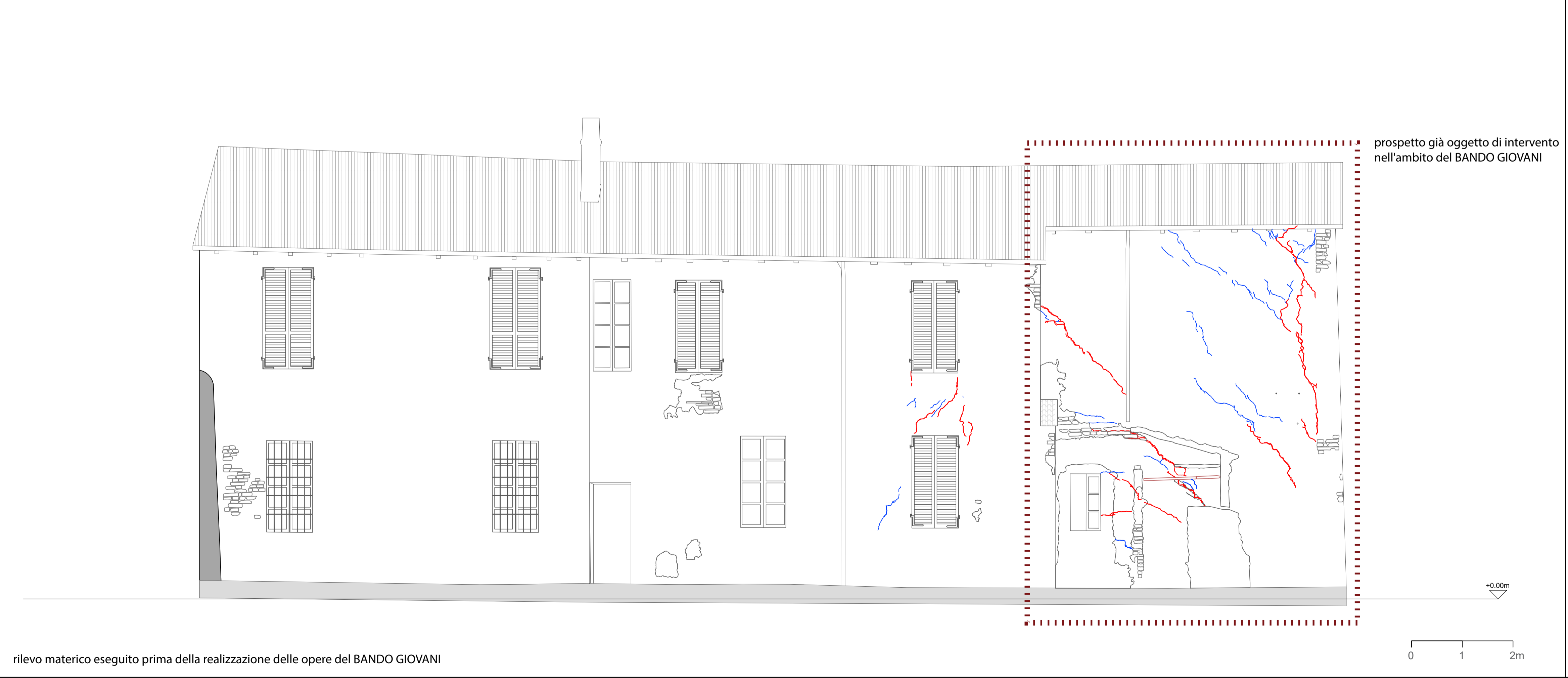
PROSPETTO NORD - OVEST