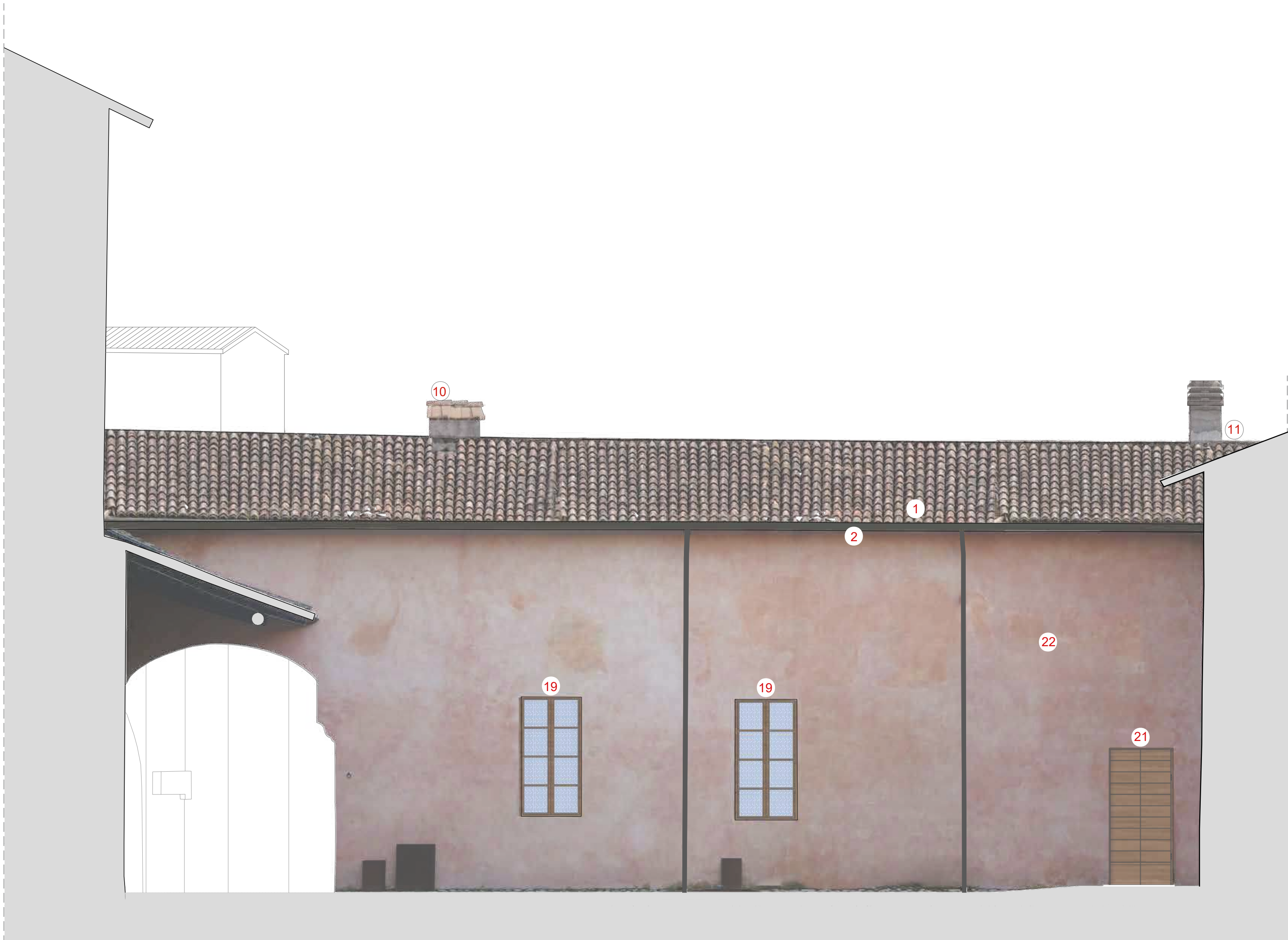
prospetto interno sud-ovest