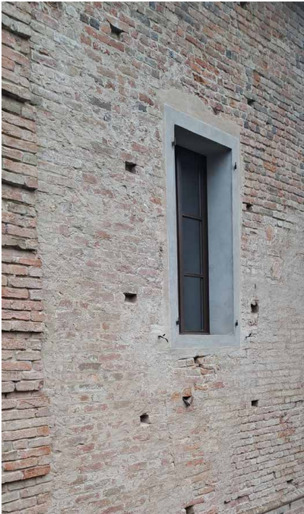
A. Finestra esistente del Castello con riquadro in intonaco colore grigio

NOTA: tutte le cromie e le finiture saranno da campionare e da sottoporre alla Direzione lavori e alla Soprintendenza prima della loro esecuzione