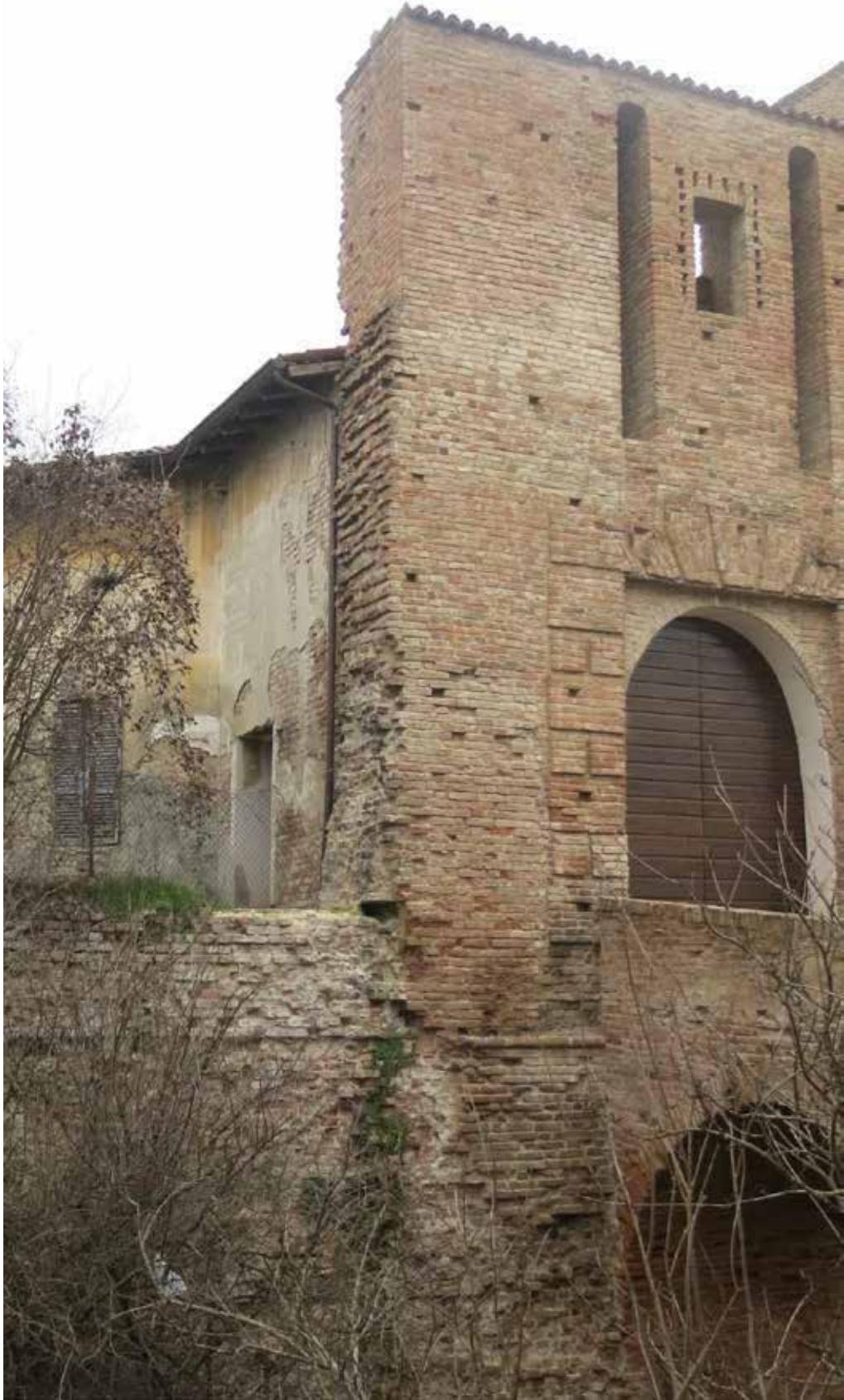
B. Dettaglio della muratura del Castello e del portone di ingresso con le due cromie di riferimento ovvero: del colore della facciata delle cucine francigene per la cromia prevalente delle fughe di malta di calce colore "calce calda"; e del portone di ingresso colore legno

"RIQUALIFICAZIONE DEL CASTELLO DI CALENDASCO HUB1" - RESTAURO DI PARTE DELL'ALA SUD-OVEST DEL CASTELLO CON MESSA IN SICUREZZA STRUTTURALE, REALIZZAZIONE DI NUOVI SERVIZI IGIENICI E REALIZZAZIONE DELLE "CUCINE FRANCIGENE"